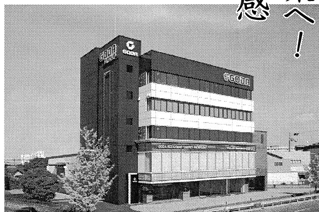
くらしの創造館 外観

資材、効 率、エネル ギーなどを 有効活用す る事業に力 を入れている。 太陽光発 電分野では 10年に太陽 光発電工事 専門校を設置。信頼性の確 立と普及促進に努めるな ど、業界全体の発展につな がる取り組みにも積極的 だ。