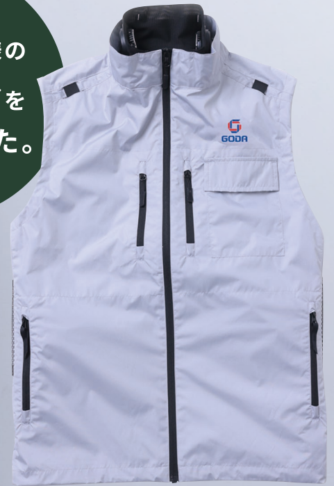
COOLFIX™ PLT2 AIR VEST SIZE:S,M,L,XL,5L